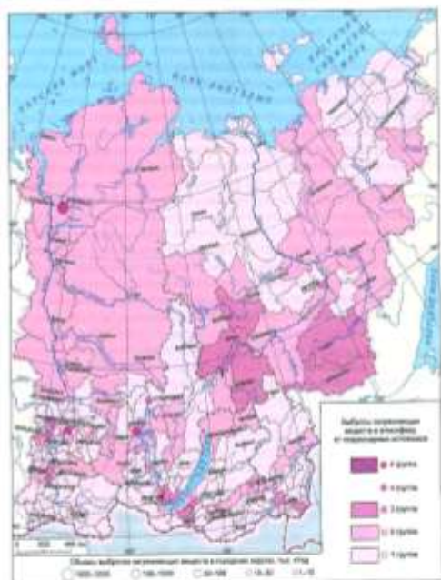
Рис. 2.3.6. Выбросы загрязняющих веществ в атмосферу в административно-территориальных образованиях.

Суть исследований состоит в комплексном рассмотрении ресурсных и социальных факторов и характеристик. При этом ресурсный блок представлен в первую очередь гидроклиматическими характеристиками, поскольку именно они в сибирских регионах являются определяющими условиями жизнедеятельности населения. В сопоставлении с процессами жизнедеятельности населения гидроклиматические показатели рассмотрены с позиции "расширенной" природно-ресурсной концепции, в соответствии с которой природные компоненты выступают в виде экологического ресурса для удовлетворения как материальных, так и нематериальных потребностей жизнедеятельности человека. При этом учитывается и существующая экологическая ситуация.